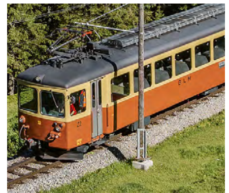
Bergbahn Lauterbrunnen – Mürren