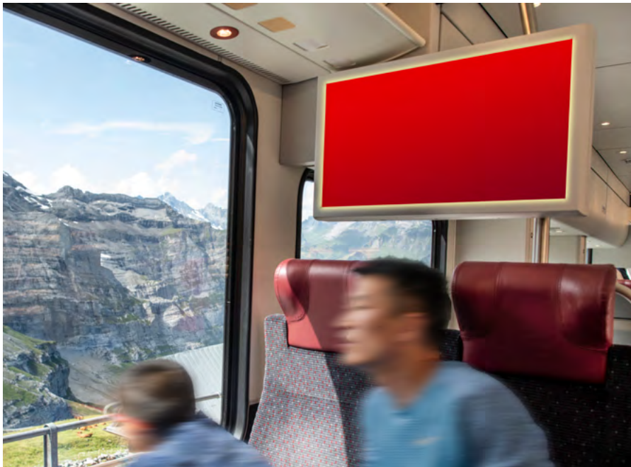
TrafficMediaScreen Jungfrau Bahn

Basis: Allgemeine Geschäftsbedingungen APG|SGA. Angaben ohne Gewähr, Angebots- und Preisänderungen vorbehalten.