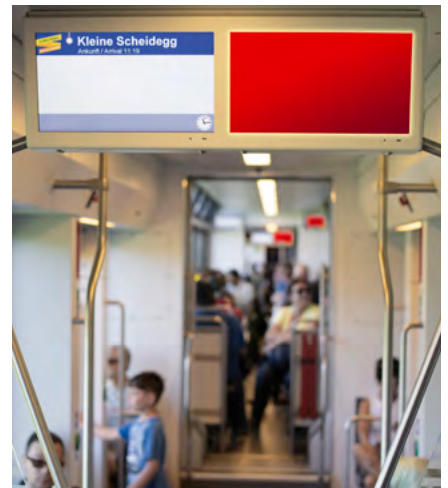
TrafficMediaScreen Jungfrau Bahn

traffic.ch/produktion/tms-produktionsangebot/