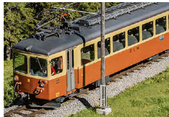
Chemin de fer de montagne Lauterbrunnen – Mürren