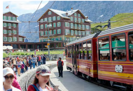
Chemin de fer de la Jungfrau