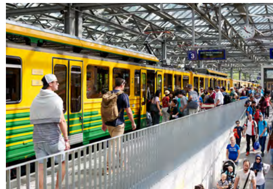
Chemin de fer Wengernalp