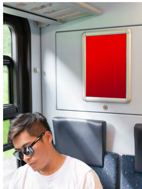
RailPosterMidi Chemin de fer de l'Oberland Bernois

traffic.ch/fr/production/donnees-techniques-formats-interieurs/