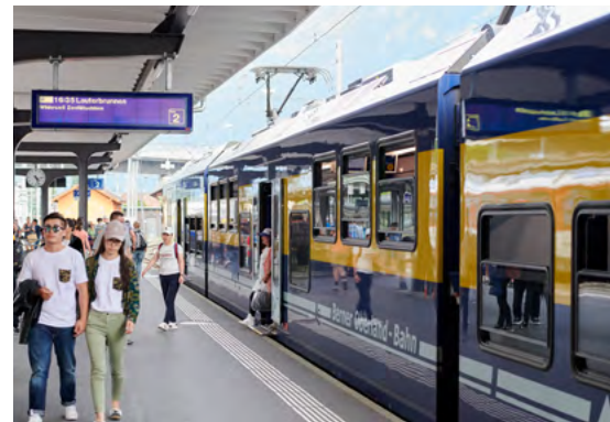
Chemins de fer de l'Oberland bernois