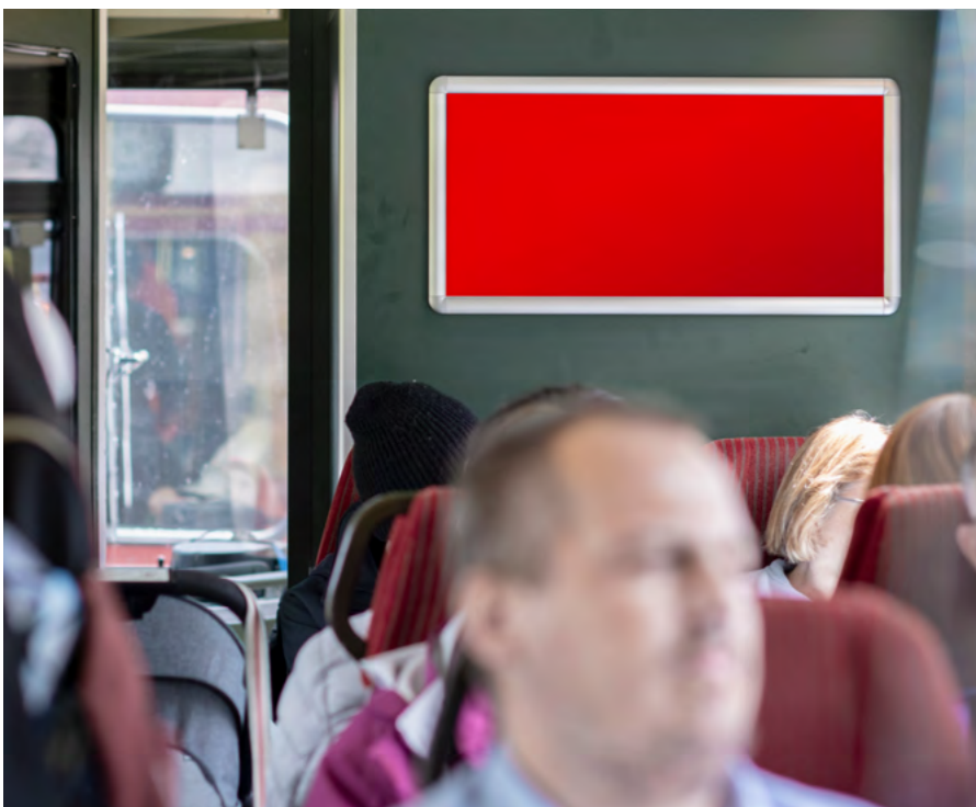
RailPoster Chemin de fer de la Jungfrau

Base: Conditions générales de vente APG|SGA. Indications sans garantie, sous réserve de modifications de l'offre et des prix.