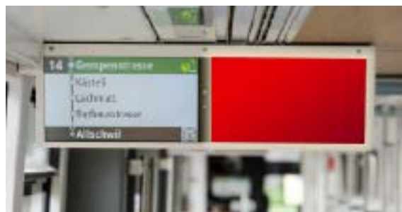
BVB Basler Verkehrs-Betriebe (City Kanal Basel)