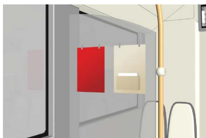
Cartons suspendus Format Standard L'impact publicitaire des cartons suspendus atteint des valeurs de pointe.

Les formats intérieurs se trouvent à portée immédiate du regard des passagers : des publicités qui sont véritablement «de proximité». Les formats intérieurs créent très rapidement des contacts. Dans les véhicules des transports publics, les passagers ont du temps, et ainsi l'occasion d'étudier les messages et les offres. Des formats standardisés et leur disponibilité dans pratiquement toutes les entreprises de transports publics permettent en outre un affichage dans toute la Suisse.