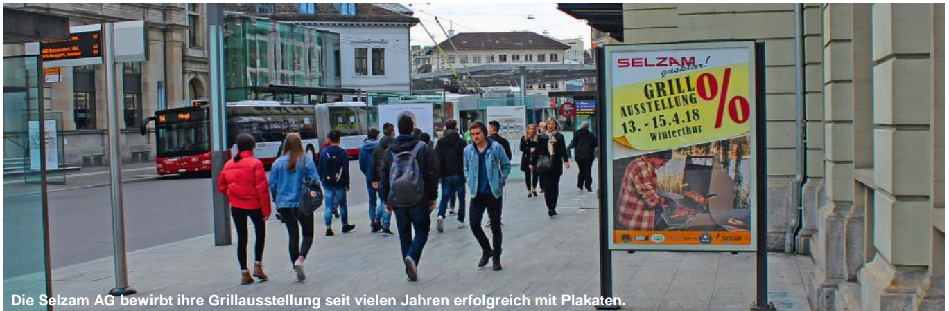
Die Selzam AG bewirbt ihre Grillausstellung seit vielen Jahren erfolgreich mit Plakaten.