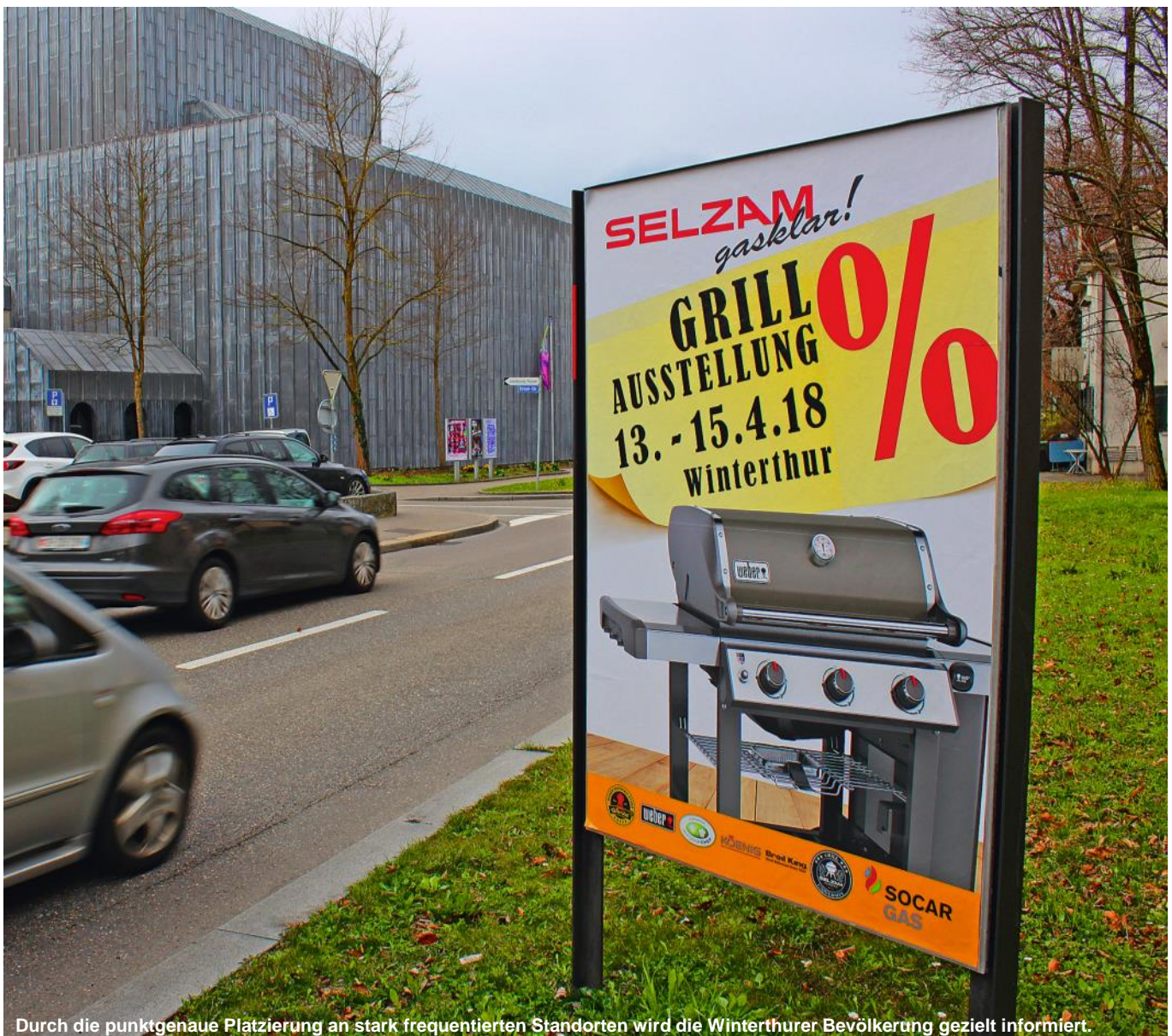
Durch die punktgenaue Platzierung an stark frequentierten Standorten wird die Winterthurer Bevölkerung gezielt informiert.