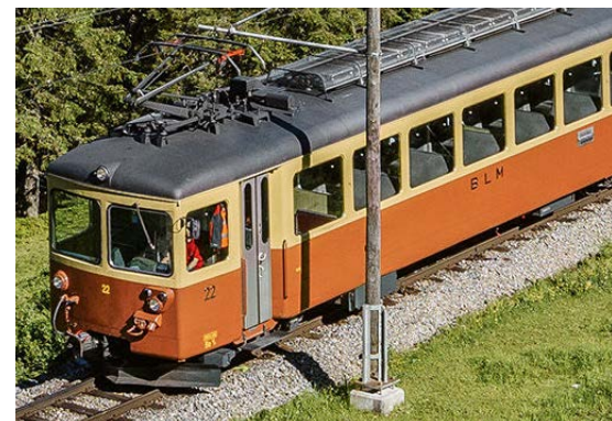
Bergbahn Lauterbrunnen – Müren