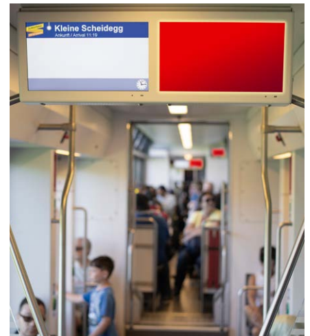
TrafficMediaScreen Jungfrau Bahn

traffic.ch/produktion/tms-produktionsangebot/