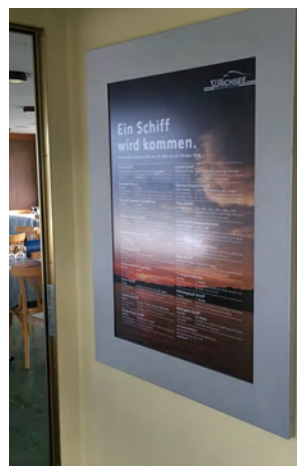
A1 hoch, mit Leuchtrahmen Gang Restaurant