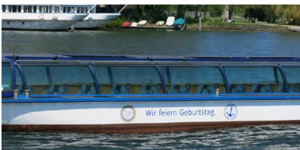
Folie Schiffsrumpf beidseitig