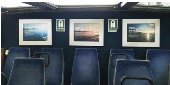
A3 quer, innen an Rückwand