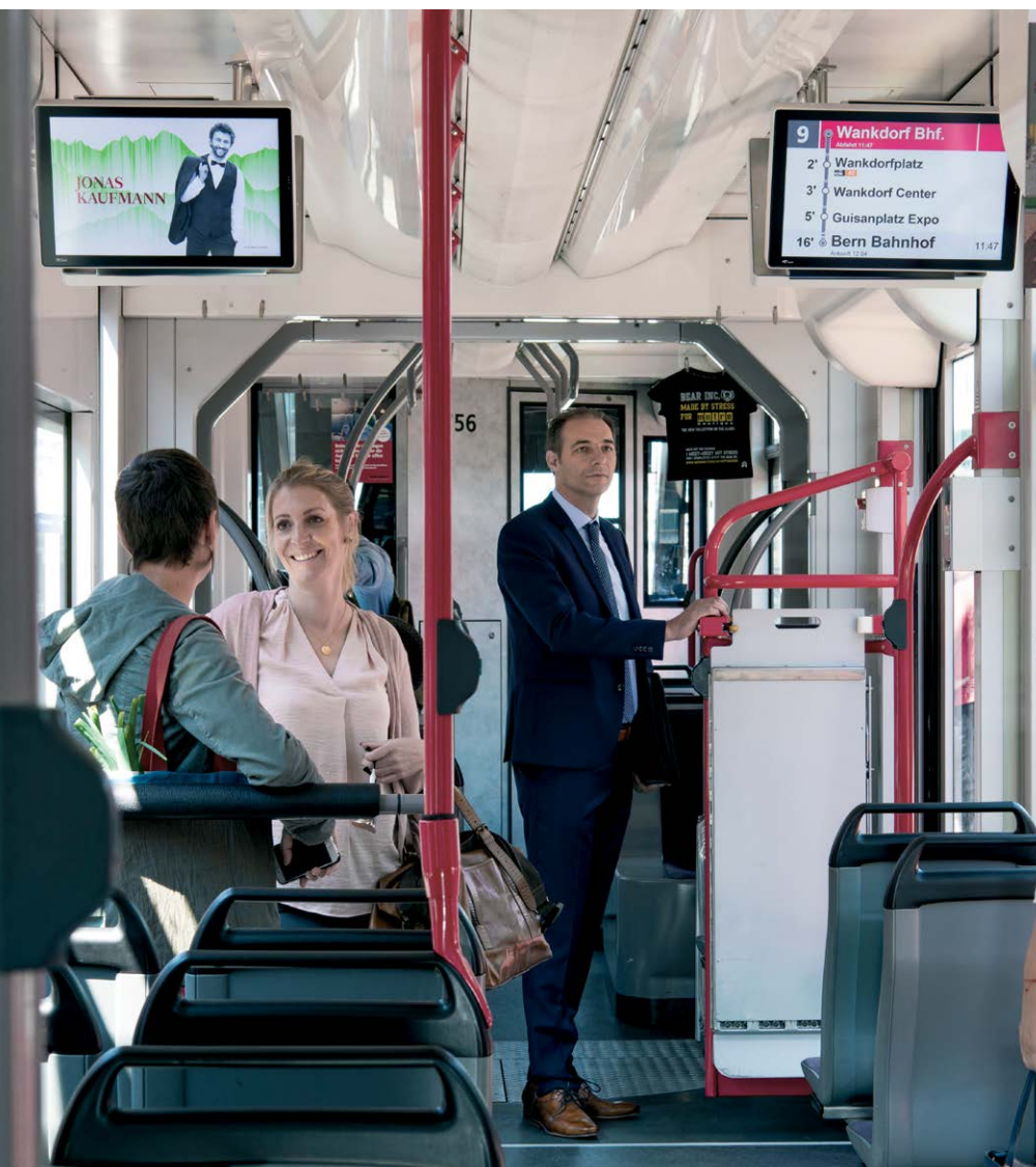
TrafficMediaScreen BERNMOBIL, Tram

TrafficMediaScreen ist mehr als einfach nur Werbung: die zwei Bildschirme vereinbaren Unterhaltung und Information zu einem attraktiven Programm für die Fahrgäste. Während auf dem linken Bildschirm Fahrstrecke, Haltestellen und Umsteigemöglichkeiten angezeigt werden, bietet der rechte Bildschirm abwechslungsreiche Informationen zu den Gemeinden im Streckengebiet.