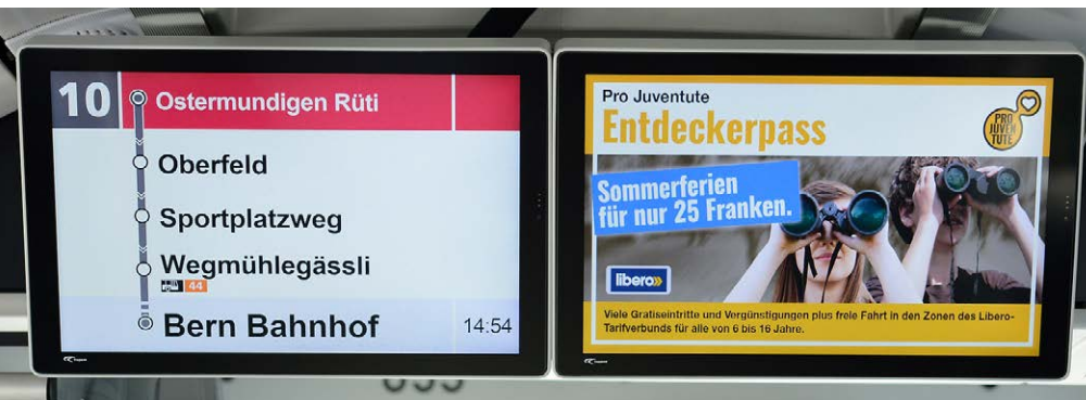
TrafficMediaScreen BERNMOBIL, Bus